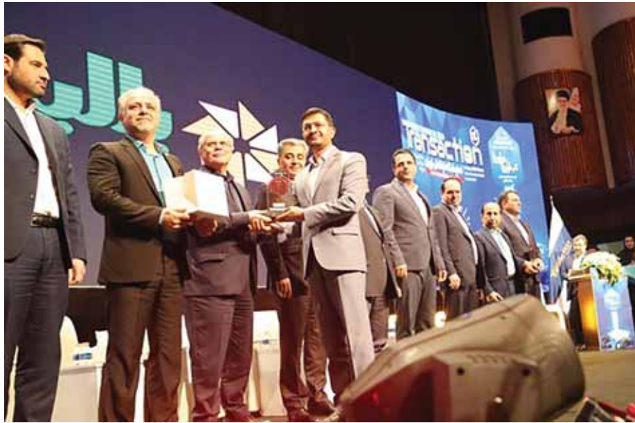
درخشش پلتفرم مدیریت زنجیره تامین بانک کشاورزی